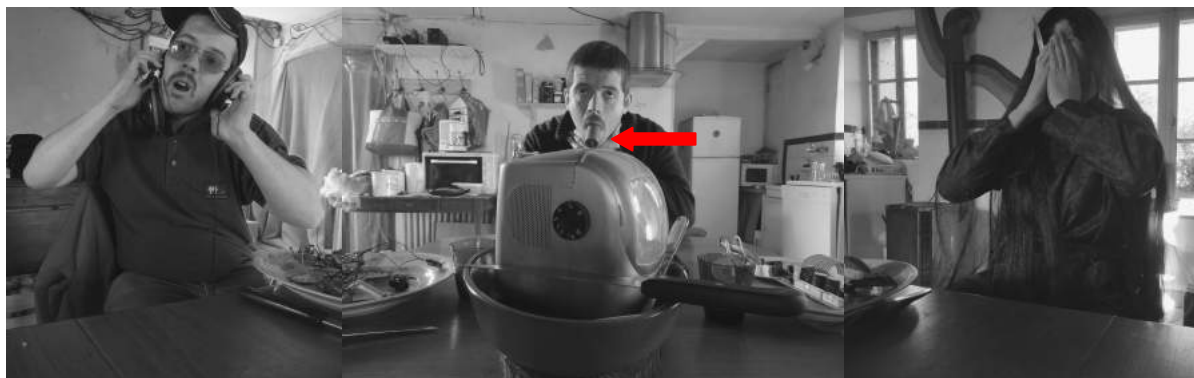
Triptyque de la scène d'étouffement (Reconstitution)

Bonnes fêtes et joyeux repas de fin d'année !