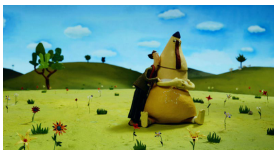
Illustration : compostage - animation - expérimental de Elise Auffray - 2'

La soupe au caillou - animation de Clémentine Robach - 7'